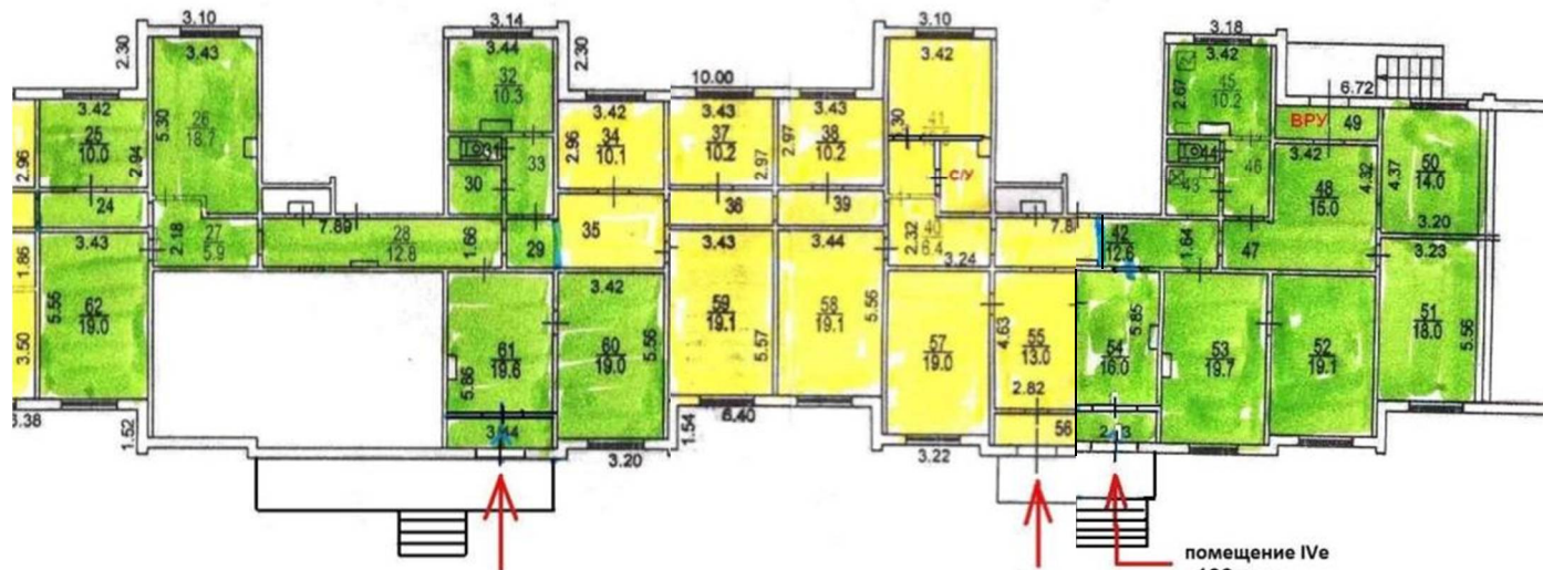
помещение IVг 131 кв.м