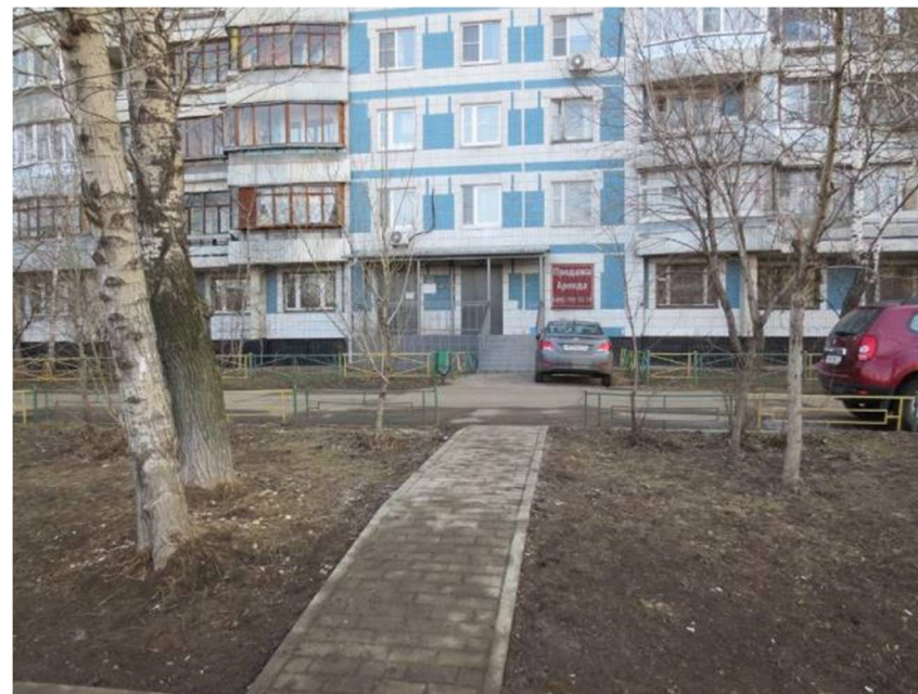
Помещение IVб - IVв