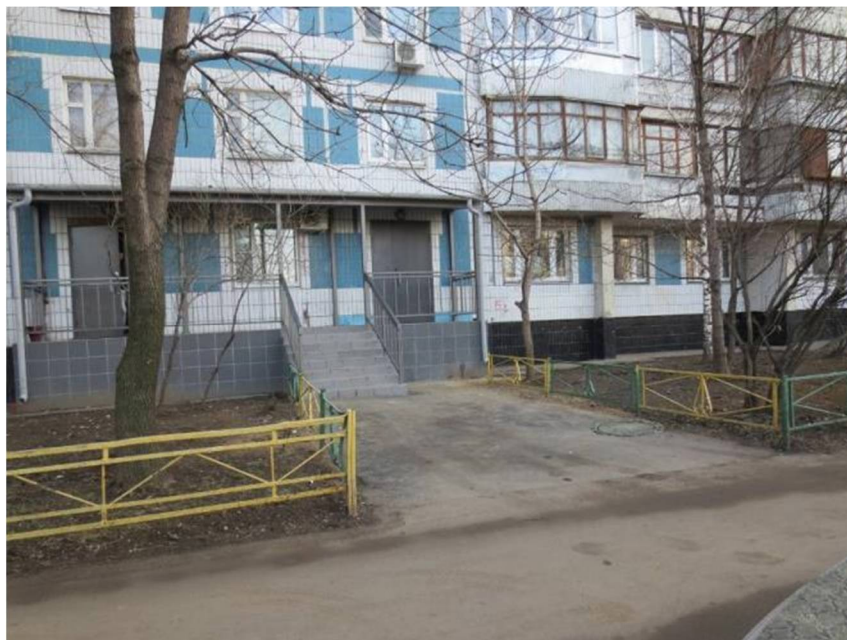
Помещение IV - IVа