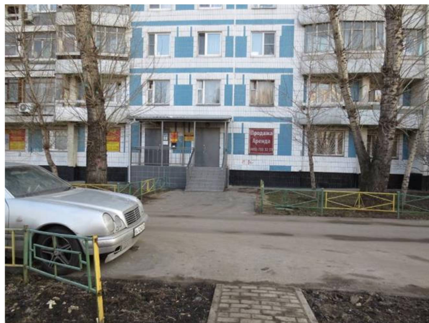
Помещение IVд - IVе